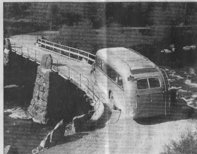
GAMMEL BRO: Hunsbedtbrua i Austerdalen fotografert cirka 1952 av Tor Hunsbedt.

Alt innsamlingsarbeidet er gjort på dugnad. Trykningen av den over 400 sider store bo-